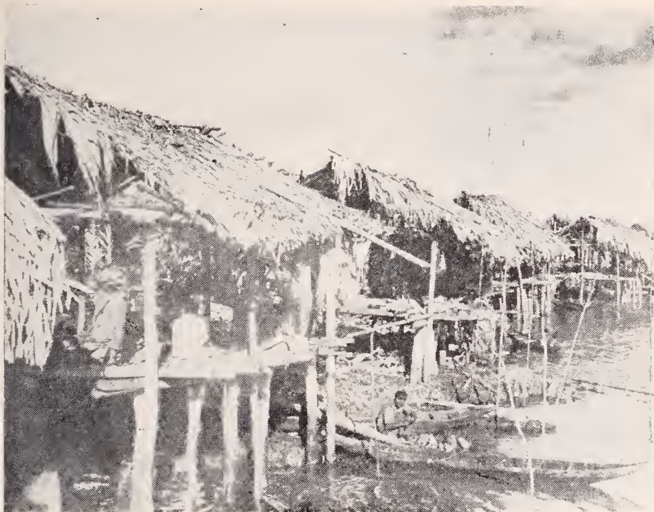
Ranchos de la Misión de Guayo.

dero de 3,85 x 4,90, los baños, sanitarios y un cuarto para dormitorio de las niñas que tienen consigo las Hnas. de 4,30 x 3,85, todo ello sobre pilares de madera.